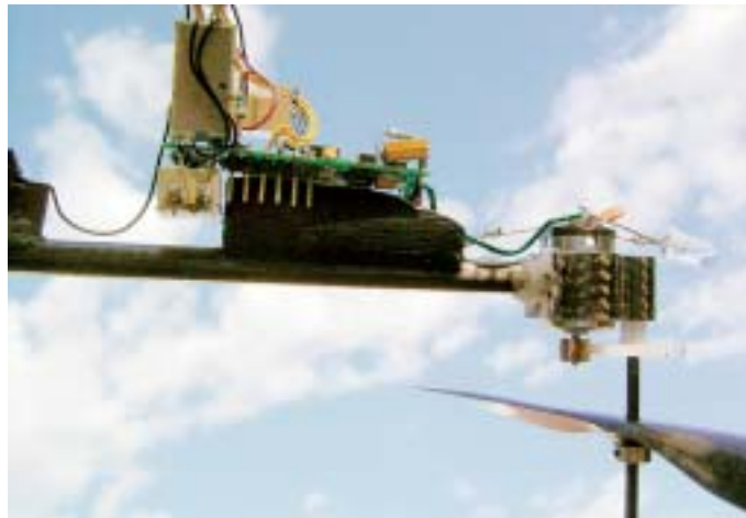
Vorderer Antrieb des Smartflyer. Bei der Präsentation zur Messe Faszination Modellbau 2004 in Sinsheim zeigte sich, dass die Zuschauer das kleine Modell gar nicht sehen konnten. Also lötete ich am ersten Abend eine helle LED an und am nächsten Tag fielen die Smartflyer deutlich besser auf.