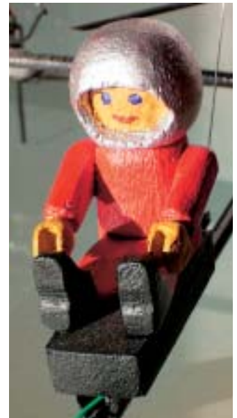
Der Pilot des Smartflyer wurde aus Balsaholz geschnitzt und von innen ausgefräst, so dass die Elektronik in Bauch, Kopf und Sitz verschwindet. Als Vorlage diente eine Playmobil-Figur.