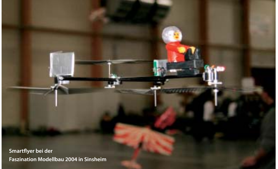
Smartflyer bei der Faszination Modellbau 2004 in Sinsheim