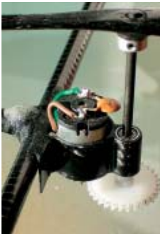
Man erkennt, wie der Propeller über dem Motor befestigt ist. Die Kabel verschwinden direkt in den Rohren.