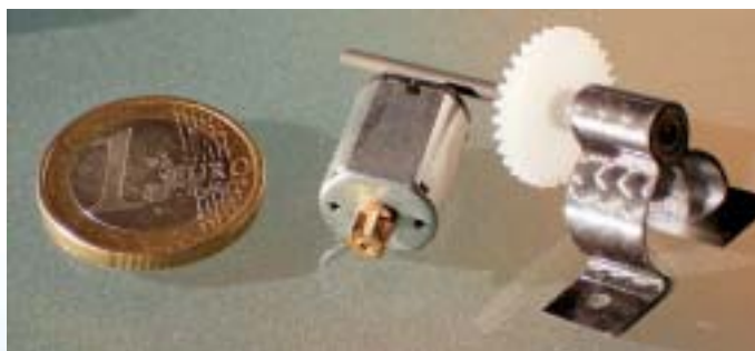
Motor mit Getriebe der Firma WES-Technik (Übersetzung 1:5); Motor wie im Heck des Piccolo und Carbonwelle mit zwei Kugellager

Ein Jahr und einige Abstürze später, gehört beim Einsteiger eben dazu, gab das Piccoboard (die zentrale Steuereinheit im Heli) nach einem Crash auf. Der integrierte Piezo-Kreisel war defekt und die von mir durchgeführte Reparatur hielt leider nur für einen Flug. Notgedrungen wurde die Schaltung für den Piezo-Kreisel einfach überbrückt. Somit übernahm das Piccoboard nur noch