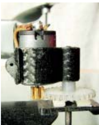
Ein Außenmotor des Smartflyer II. Die Kabel verschwinden direkt in den Rohren. Der Propeller (Heckpropeller des Piccolo) ist mit doppelseitigem Klebeband auf das Zahnrad geklebt.

in sehr kleinen und engen Räumen sicher bewegt werden können, was ich mit einer elektronischen Taumelscheibe realisieren wollte. Für die Stabilisierung bzw. Steuerung der Funktionen Heck, Roll und Nick hatte ich gleich drei Kreisel vorgesehen. Während ein Arbeitskollege von mir eine universal einsetzbare Leiterplatte, bestückt mit drei Kreiseln, vier Drehzahlreglern und dem Mikrokontroller ATmega8 entwarf, begann ich mit der Entwicklung der Software. Nachdem die unbestückten Leiterplatten geliefert wurden, bestückte ich zunächst eine davon so, dass sie mit der entsprechenden Software die Aufgaben eines Piccobords übernehmen konnte. Dieses Board steuert noch heute meinen Pro-Piccolo. Mit den Erkenntnissen, die ich