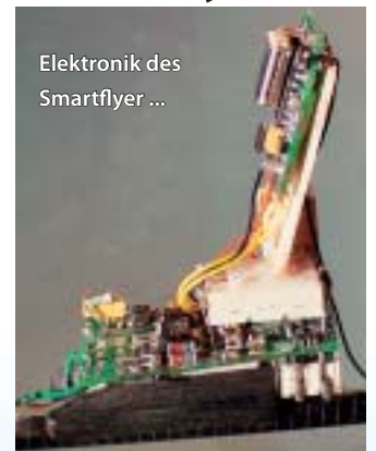
Elektronik des Smartflyer ...

Durch die Reparaturversuche wurde in mir das Interesse für den Eigenbau einer solchen kompakten Steuereinheit geweckt. Hierzu bot sich der Mikrokontroller AT90LS4433 von Atmel für mich besonders an, da ich dessen Funktion beruflich bereits sehr gut kennen gelernt hatte. Nach einigen Versuchen entstand ein gut funktionierendes System, dessen Hecksteuerung sogar mit einer Heading-Lock-Funktion ausgestattet war. Der damit ausgerüstete Piccolo wurde von mir beim Helipoint Indoor Meeting 2003 in Neuenbürg vorgefliegen. Schon hier weckte die selbstgebaute Steuereinheit bei den anwesenden